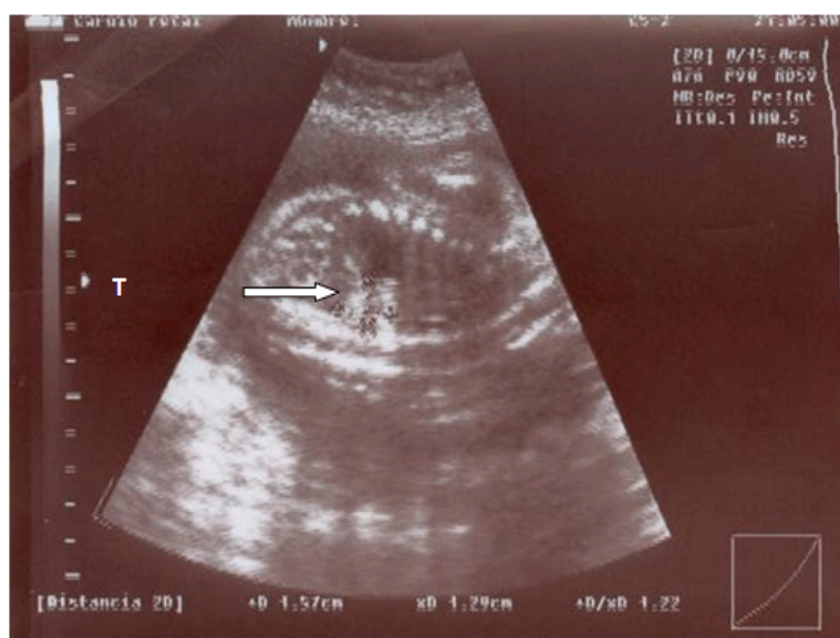
Fig. 1. Imagen hiperecogénica por encima polo superior del RI que mide 1,5X1,2 cm

El día 24 de mayo acude para que se le realice dicho examen, y se encuentran ambos ecocardiograma fetales normales, pero se decide realizar ecografía completa, donde se encuentra en el primer gemelar una tumoración hiperecogénica de forma triangular que mide 15 X 12 mm por encima del polo superior del riñón izquierdo y por debajo del diafragma. El resto del examen de ese feto era normal. (Figura 1 y Figura 2).