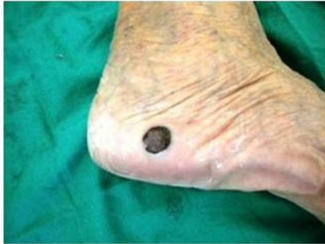
Fig. 1. Melanoma nodular borde externo de pie derecho, 3x3 cm de diámetro, elevado, de color negro, y bordes irregulares.

Complementarios realizados: Hemograma completo y eritrosedimentación dentro de límites normales, perfil hepático y renal normal. Electrocardiograma: Normal. Rayos X de tórax: No se observan alteraciones pleuropulmonares. Ultrasonido abdominal: Sin alteraciones.