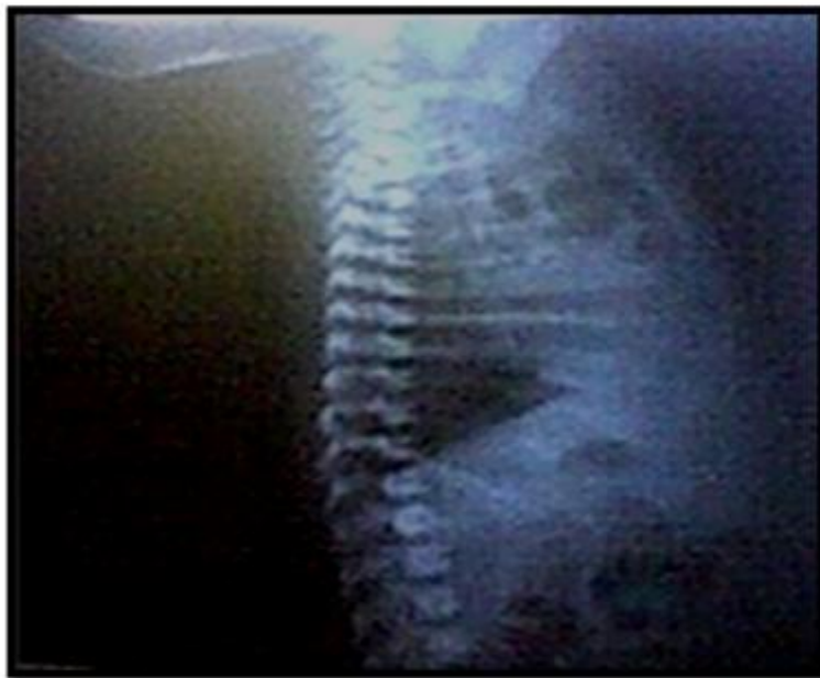
Fig. 1. Imágenes quísticas pulmonares retroesternales en vista lateral (oblicua derecha).

A los 7 días de vida, en la radiología de tórax evolutiva con vista lateral y anteroposterior (Figura 1 y Figura 2 ) se observó persistencia de los quistes pulmonares y el derrame pleural se había resuelto. Se realizó además un estudio de tránsito intestinal que resultó normal, en aras de establecer el diagnóstico diferencial con la hernia diafragmática congénita.