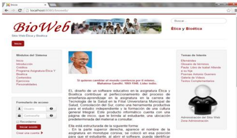
Fig. 1. Muestra la página principal del sitio.

La imagen y frase del líder indio Mahatma Gandhi, así como una breve descripción de la importancia del software para el perfeccionamiento del proceso enseñanza aprendizaje de la asignatura ética y bioética de la carrera Licenciatura en Tecnología de la Salud. A través de la misma se puede acceder a las distintas secciones, en correspondencia con los intereses del usuario y se encuentra en la parte superior izquierda el logotipo del sitio. Figura 1.