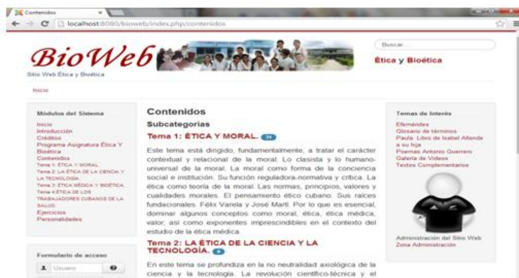
Fig. 2. Sección. Tema 1.