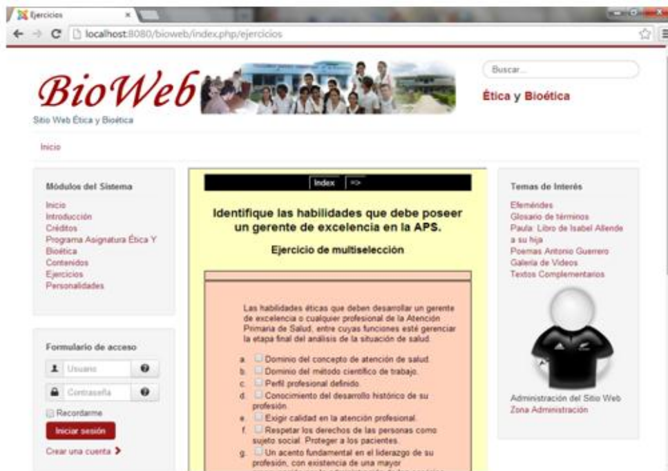
Fig. 4. Ejemplo de uno de los ejercicios propuestos utilizando el programa de ejercicios educativos Hot Potatoes.