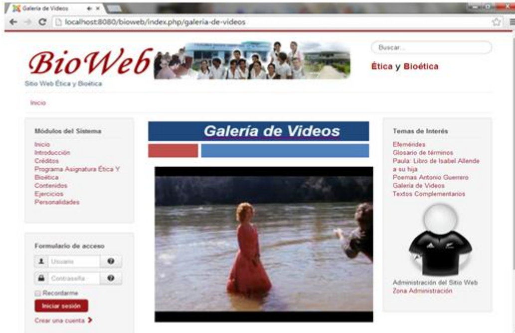
Fig. 3. Muestra un ejemplo de uno de los ejercicios propuestos.

En la sección galería de videos. A través del botón desplegable es posible seleccionar cuáles descubrir en concordancia con el tema. En la lista que aparece se pueden observar las del tema seleccionado más alguna información adicional, aparecen las imágenes, una vez seleccionadas estas son pueden ser expuestas en un tamaño mayor. Figura 3.