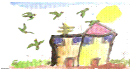
Figura 3. Niño DP, 6 años. "Mi familia en el presente."

completar frases (Rotter), señalan que el contenido de estas ideas está vinculado a la figura parental emigrada: al cariño atribuido a esta persona, a las relaciones afectivo-emocionales estrechamente cercanas y a la necesidad de contacto, de volver a ver, de compartir con la madre o el padre ahora ausente físicamente. En el dibujo libre se identifica la seriación de elementos que, gráficamente, expresa la detención del sujeto en un esquema gráfico, lo cual equivale a la presencia de alguna idea fija en el sujeto. En el caso del dibujo "Mi familia ahora" (figura 3), los elementos seriados son aves, lo que puede estar relacionado con la representación del padre que está lejos, que se fue a otro país, que emigró, estableciendo cierta comparación entre los elementos representados gráficamente y las cogniciones asociadas a estas figuras.