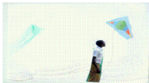
Figura 4. Niño RS, 7 años. "Mi familia en el presente."

En la técnica creativa de arte terapia, en el dibujo que representa a la familia en el presente (figura 4), uno de los niños (sujeto 1), solamente se representa a sí mismo empujando un papalote, de modo que eso es lo que significa su familia ahora, en este momento; y es una muestra además de las ideas de abandono que suelen presentar estos niños cuando una figura significativa para ellos viaja a otro país.