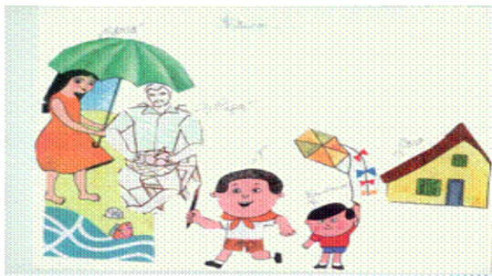
Figura 5. Niño HB, 11 año. "Mi familia en el futuro."

que los hijos vivencian la emigración de sus progenitores como abandono en algunos casos y en otros desde la deslealtad (7). En esta investigación también se evidencia la incertidumbre respecto al futuro familiar, pero con la diferencia de que en nuestra investigación sí se ha constatado que, a pesar de las dudas que los niños puedan presentar respecto al momento del reencuentro y el temor de que no suceda, sí existe en ellos la perspectiva de volver a estar con sus padres y de reestablecer la armonía familiar existente antes de la emigración. (Técnica creativa de arte terapia - figura 5)