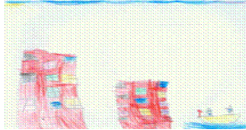
Figura 2. Niño RS, 7 años. "Dibujo libre."

frustrante para los niños estudiados, en este caso, la posibilidad de peligro o de inseguridad al verse separados de figuras con las que mantenían un fuerte apego y relaciones fusionadas en todos los casos evaluados.