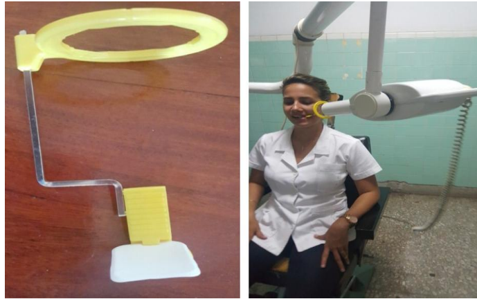
Fig. 1 Sistema XCP para sector posterior con sus componentes esenciales antes y después de colocar en zona de bicúspides y molares superiores.

Con el empleo del método periapical por bisección, el 45 % de casos presentaron superposiciones del piso del seno maxilar a las raíces de bicúspides y/o molares superiores mientras que las superposiciones del proceso cigomático se presentaron en 26,2 % de los pacientes. Por otra parte, las distorsiones más frecuentes con el método por paralelismo fueron las superposiciones de piso de seno y del proceso-hueso cigomático a las raíces superiores con un 10 y 5 % respectivamente. (Tabla 2)