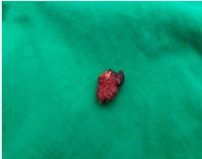
Fig. 2 Se ilustra ganglio linfático de región cervical derecha pos extirpación.

En el examen macroscópico del espécimen quirúrgico se observa: formación ovoide de tejido que mide 2,5x1,2x0,8cm, superficie lisa con áreas congestivas y de consistencia fibroelástica. (Fig. 2)