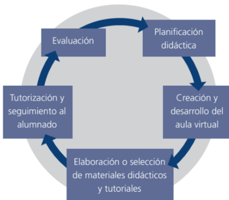
Fig. 1 Fases del proceso de creación de un curso virtual. (11)

Para la creación del curso se tuvieron en cuenta las siguientes fases reveladas por Área Moreira. (11) (Fig. 1)