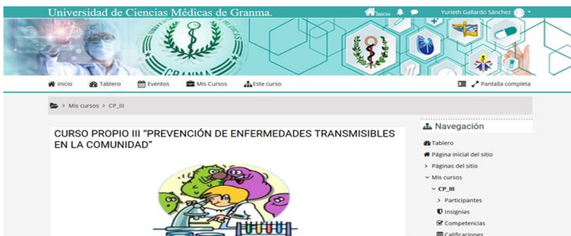
Fig. 2 Curso virtual Prevención de las enfermedades transmisibles en la comunidad. Aula virtual de la Universidad Médica en Granma.

El curso virtual (fig. 2) se organizó en general según las orientaciones metodológicas descritas en el Manual del Aula Virtual de la red de INFOMED que es extensiva para las restantes del país. Se ejecutó sobre la plataforma del aula virtual de la Universidad de Ciencias Médicas de Granma ( www.aula.grm.sld.cu ). Cuenta con la identificación de curso titulado Prevención de las enfermedades transmisibles en la comunidad. Incluye además un programa donde se declaran los propósitos de formación, justificación, metodología a seguir por los estudiantes y profesores durante el curso, unidades de aprendizaje bien definidas, la gestión de evaluación, el calendario para el desarrollo de cada actividad y la bibliografía que se empleará para el estudio de cada unidad de aprendizaje.