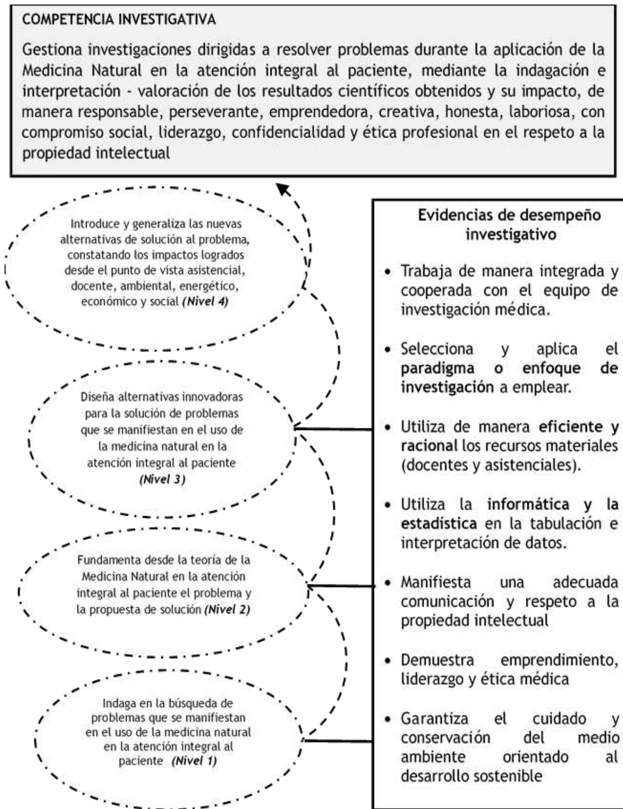
Fig. 1 Perfil de la competencia investigativa a evaluar en el estudiante de la maestría en MN en la AIP