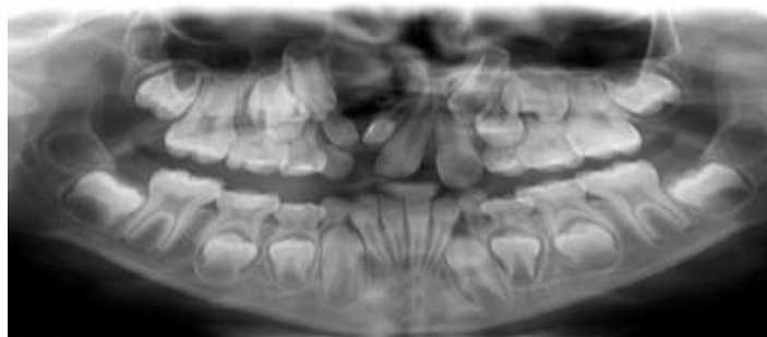
Fig. 1 Radiografía panorámica del paciente.

Se realizó como parte del tratamiento para la comunicación bucosinusal una placa obturadora con tornillo de expansión con el propósito de estimular el crecimiento del hueso maxilar y para una mejor función, fonación, estética y deglución. Se realiza interconsulta con cirugía maxilofacial para posterior cirugía de aproximación de tejidos blandos. Se estableció comunicación con los padres del paciente para brindar educación sobre la temática, así como se le dieron instrucciones de higiene dental para el niño, siendo necesario además terapia de lenguaje y cirugías para correcciones de nariz y labio. El paciente de acuerdo con su edad tiene que continuar con su tratamiento multidisciplinario.