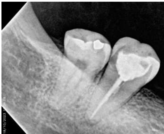
Fig. 5 Radiografía de control.