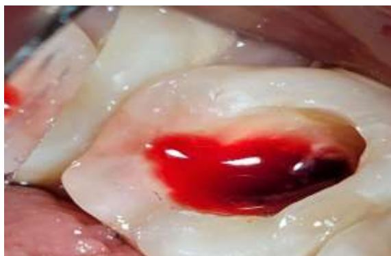
Fig. 2 Preparación químico mecánico de 37 (primera sesión).