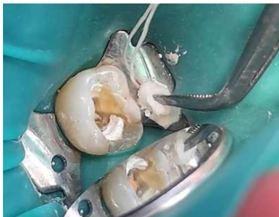
Fig. 3 Medicación intraconducto de 37.