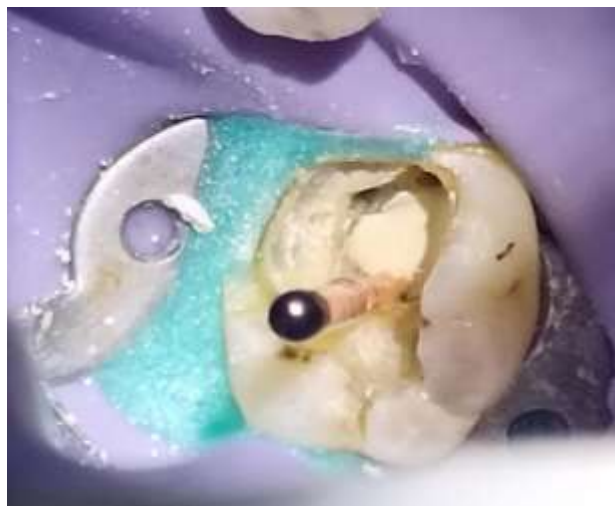
Fig.3 Cono de gutapercha 40.05 con vaselina dentro del conducto.

Posteriormente, con los conos dentro de los conductos, se selló la perforación con Biodentine (Septodont, Francia) siguiendo las instrucciones del fabricante para su mezcla y se esperó 15 minutos, se retiraron los conos de gutapercha, se rellenaron los conductos con mediación intracanal ( \text{Ca}(\text{OH})_2 ) y se colocó IRM (Dentsply Sirona, Suiza) como material de obturación provisional por siete días. Se recetaron analgésicos y la paciente comentó que estuvo asintomática a partir del día siguiente. La paciente fue llamada después de los siete días para la obturación definitiva de los conductos radiculares con cemento endodóntico Ah plus (Dentsply Sirona, Suiza). Luego de un mes se realizó la radiografía de control donde se pudo observar el sellado completo de la perforación (Figura 4) pero con signos de un proceso apical que estaba en proceso de sanación.