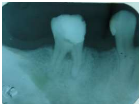
Fig. 4 Sellado de la perforación.

Posteriormente, con los conos dentro de los conductos, se selló la perforación con Biodentine (Septodont, Francia) siguiendo las instrucciones del fabricante para su mezcla y se esperó 15 minutos, se retiraron los conos de gutapercha, se rellenaron los conductos con mediación intracanal ( \text{Ca}(\text{OH})_2 ) y se colocó IRM (Dentsply Sirona, Suiza) como material de obturación provisional por siete días. Se recetaron analgésicos y la paciente comentó que estuvo asintomática a partir del día siguiente. La paciente fue llamada después de los siete días para la obturación definitiva de los conductos radiculares con cemento endodóntico Ah plus (Dentsply Sirona, Suiza). Luego de un mes se realizó la radiografía de control donde se pudo observar el sellado completo de la perforación (Figura 4) pero con signos de un proceso apical que estaba en proceso de sanación.