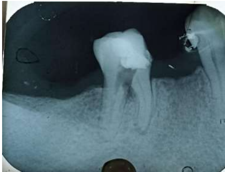
Fig.1 Perforación en la unión de las dos raíces del O.D # 4.6.

Después de la anestesia con mepivacaína con adrenalina (1/1000000) (Septodont, Francia), se procedió a descontaminar la perforación mediante la aplicación de hidróxido de calcio puro \text{Ca}(\text{OH})_2 con la ayuda de un porta amalgama y se dejó por 15 días. En la segunda cita, se retiró la restauración temporal que se colocó en la cita anterior. Se observó que la cavidad estaba seca. Se confirmó la perforación de la furca mediante observación directa (Figura 2).